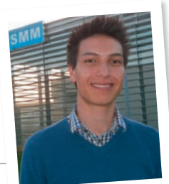
Thanoukham PT Joliot 2012 ENSM

*« Les colles : un très bon exercice pour développer la confiance en soi, la rigueur et l'esprit de synthèse. »