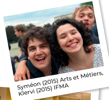
Syméon (2015) Arts et Métiers, Klevi (2015) IFMA